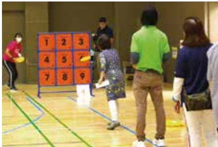
フライングディスク体験