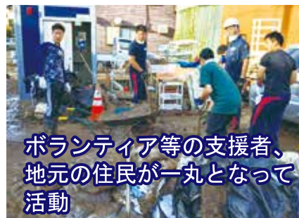
ボランティア等の支援者、地元の住民が一丸となって活動

現地では重機を扱う技術ボランティア、資材を貸与してくれるNPO法人など多様な方々が協力し合い、着実に復興に向けた歩みを進めていきました。