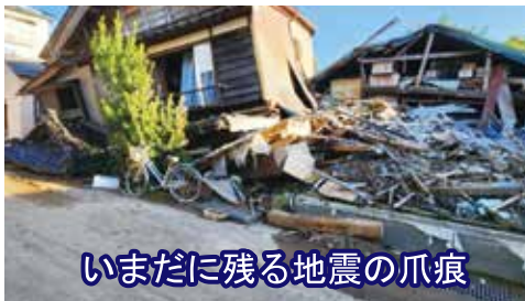
いまだに残る地震の爪痕

大きな災害が発生したとき、被害を受けた地域で「支援が必要な人」と、「ボランティア活動を行いたい人」を繋ぐため、被害を受けた市町村社協が災害ボランティアセンターを設置します。今回は「輪島市災害たすけあいセンター」運営支援のために派遣した職員からの報告をお届けします。