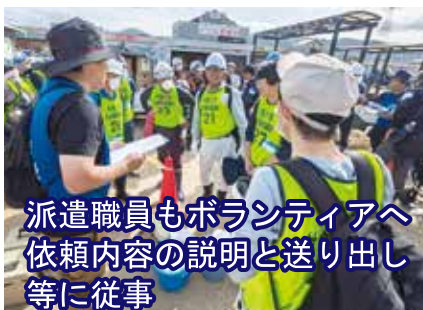
派遣職員もボランティアへ依頼内容の説明と送り出し等に従事