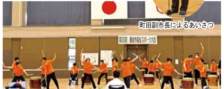
おどる太鼓クラブによる和太鼓演奏