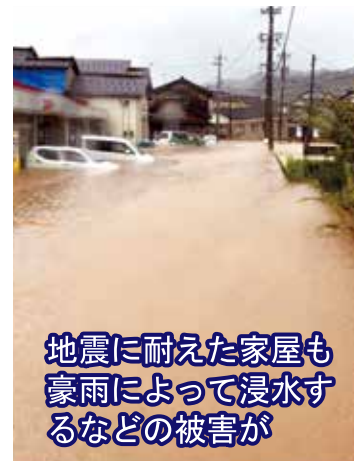
地震に耐えた家屋も豪雨によって浸水するなどの被害が

派遣当初は豪雨災害の発災から間もない時期であり、ボランティアを安全に送り出せる状況にないため、「災害たすけあいセンター」としてはニーズ収集と新たに水害ニーズに対応する準備を整え、9月27日から再び、ボランティア派遣を再開しました。