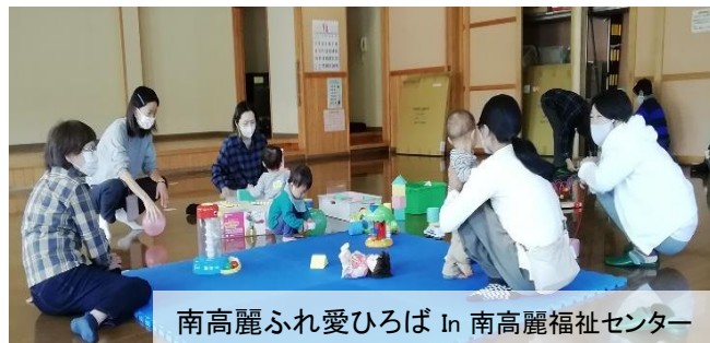
南高麗ふれ愛ひろば In 南高麗福祉センター