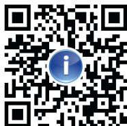
社協ホームページ

社協の取組情報は、こちらのホームページ、SNSでも発信しています。スマートフォンをお使いの方は、ぜひこちらをご覧ください。