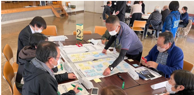
【イメージ】精明地区ふくし懇談会の様子

加治東、加治地区にお住いの皆さんが、ふだんの暮らしの中で、どのような生活のしづらさや課題に感じているかを話し合う「地区ふくし懇談会」を右記のとおり開催しますので、ぜひご参加をお待ちしています。