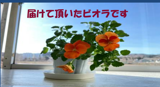
届けて頂いたビオラです

サロンだよりと一緒にビオラや二十日大根の種、お手玉をお届けして、栽培や収穫など、自宅ですることを楽しんで頂いています♪