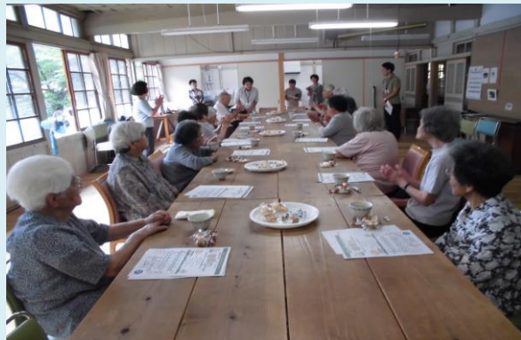
茶の間・サロン活動

地域の居場所としての「茶の間・サロン」や移動交通「らくだ号」の活動を行っています。「たすけあいあがの」では、これからの担い手を募集しています！一緒に、住みよい吾野を目指しましょう！社会福祉協議会と「たすけあいあがの」は、「ふくしの地域づくりパートナーシップ協定」を結び支援をさせていただいています。