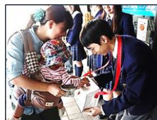
左：街頭募金の様子 右：サロン活動の様子

毎年、10月に入ると駅の構内やスーパーマーケットの入口などで様々な団体による街頭募金が行われています。見かけた際にはご協力をお願いいたします。